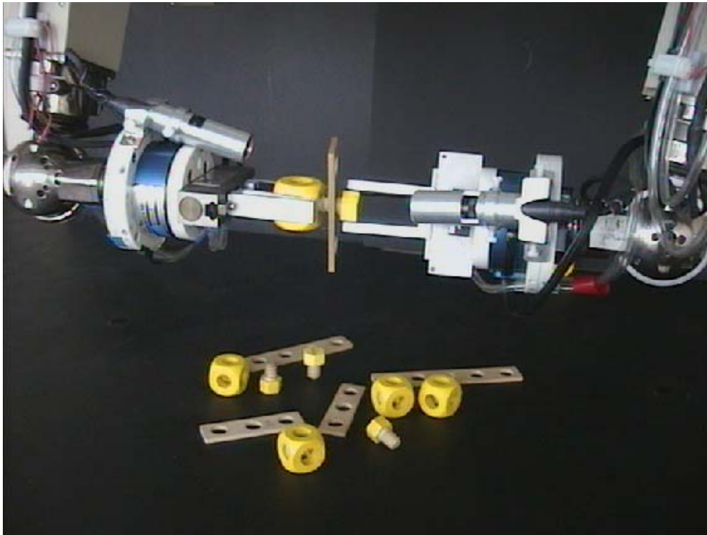
Abbildung 3: Umsetzung einer Schraub-Anweisung

den Greifbacken eine Ausrichtung nicht möglich ist. Für solche Fälle ist vorgesehen, daß der SKK den Instrukteur um aktive Hilfe bittet, d.h. der SKK erkennt seine Grenzen und fordert den Instrukteur auf, die gewünschte Aktion zumindest partiell selbst auszuführen. Die dafür benötigte Dialogkomponente muß noch entwickelt werden, wobei die Ergebnisse und die Erkenntnisse anderer Teilprojekte des SFB einfließen werden. Die Grammatik und das Lexikon wird fortlaufend ausgebaut und den erweiterten Möglichkeiten des Konstruktionsroboters angepaßt. Hierbei werden die empirischen Befunde der psycholinguistischen Experimente zum Sprachverstehen berücksichtigt (z.B. [29]), um ein Gesamtsystem zu erhalten, das im Sinne der experimentell-simulativen Methode neue Fragestellungen aufwirft und gegebenenfalls seinerseits als Experimentalumgebung dienen kann.